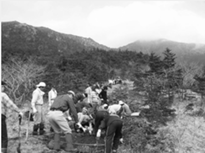
ジオサイト 【B6】 高山植物再生実験地での作業風景 (2007年4月)

【B6】アポイ岳は、このジオパークを代表するジオサイトのひとつ。なんといいてもここで見られないものを含む豊富な高山植物が一番の見どころ。でも、その高山植物たちは今、ものすごいスピードでその数を減らしていて、まだその原因ははっきりしていません。