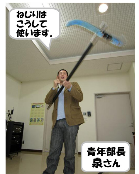
ねじりはこうして使います。

次に拾い昆布。単に手で拾うほか、水中のものはカギで引き寄せても採る。このカギ竿では届かない場所にあるものは「マッケ」を使う場合もある。ロープを結んだマッケを海中に投げ、昆布をひっかけながらロープで回収する。岩場に引っかかっても強く引っ張ると曲がって外れるようにするため、マッケの先の部分は曲がるようにできている。18歳の若者から80歳の老人まで年代に関係なく自分の体力に合わせてやれるのが拾い昆布の良いところでもある。