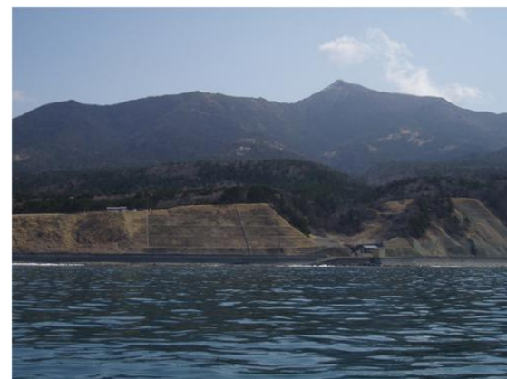
沖から見る漁場は、まさにアポイの根っこ